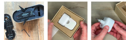
La piastra di installazione con le due viti di serraggio vicino al foro in alto, la brugola esagonale e le alette aperte nel corpo principale di Linus. Si noti il foro rettangolare dove entrerà la chiave con elemento di spinta a molla. Confezioni in cartone riciclato Ecco Connect fuori dalla scatola